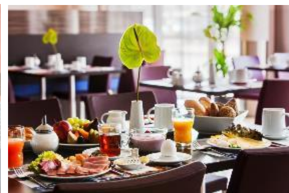
SARL TOURS SQUARE

29, rue de la Grosse Pierre – ZI de la grosse pierre – 78540 VERNOUILLET – Tél. : 01 39 11 65 59 – contact@tourssquare.com